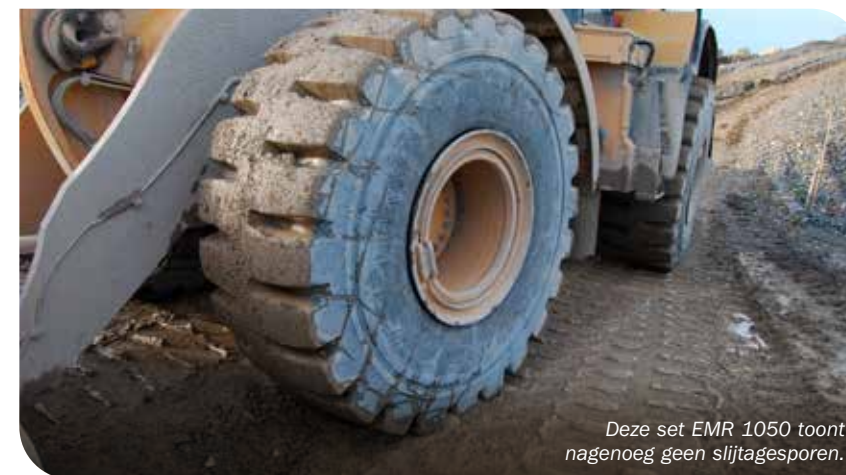
Deze set EMR 1050 toont nagenoeg geen slijtagesporen.

De Trelleborg EMR-serie is ontworpen om de productiviteit te verbeteren in kritische bouwtoepassingen, door zowel een verbeterde bescherming tegen schade als duurzaamheid te bieden. Het multi-surface loopvlakprofiel biedt controle en een perfecte grip. Het sterke radiale karkas en de ultramoderne