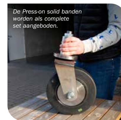
De Press-on solid banden worden als complete set aangeboden.