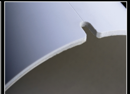
Découpe des adhésifs aisée grâce aux traçages