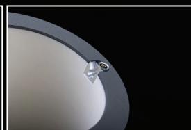
Mise en registre précis et durable. Insert en aluminium