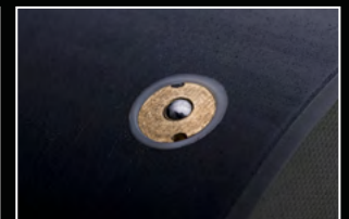
Válvulas de bola