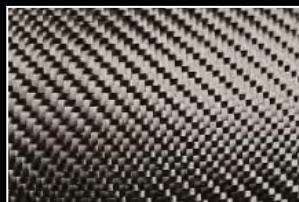
Fibra de Carbono Alto Modulo