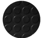
Pastilles (MC 2K1)