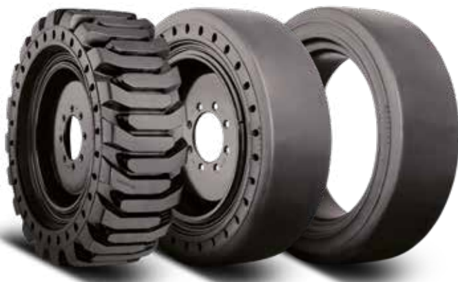
HPS Solidflex Traktion