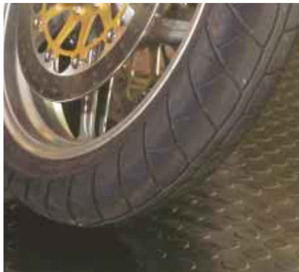
Tål fysiskt slitage