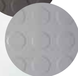
Checker Stud Pastillmönstret