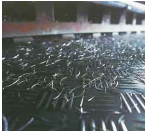
Dämpar hårda ljud