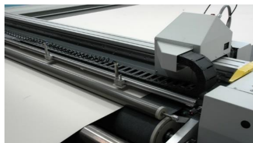
El equipo CAD de Hubergroup UK ofrece un medio muy eficaz de producir volúmenes pequeños o grandes de mantillas de impresión offset a partir de rollos.

Las ventas de tinta son una parte importante de la actividad de la empresa. Las tintas se reciben a granel de la fábrica continental del grupo y se mezclan en la planta de GB, uno de los principales proveedores de colores suplementarios del país.