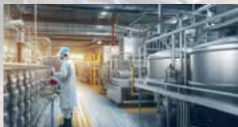
FOOD & BEVERAGE PRODUCTION