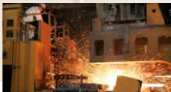
MANUFACTURING & MACHINE TOOLS