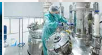
CHEMICAL FLUID TRANSFER