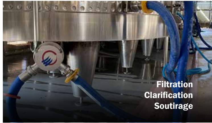
Filtration Clarification Soutirage