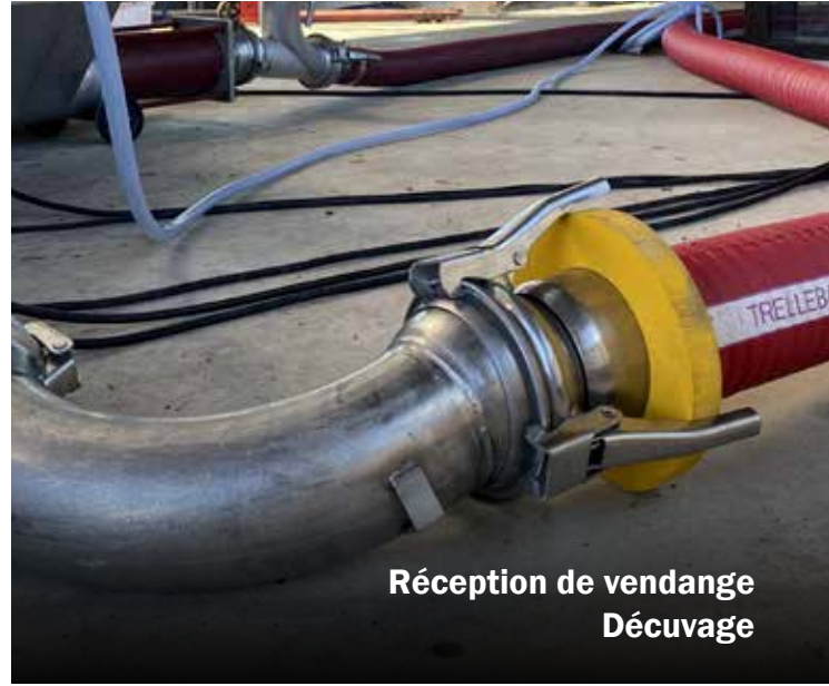
Réception de vendange Décuvage