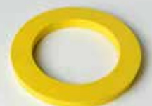
ANNEAU DE PROTECTION CAOUTCHOUC