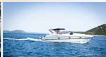
MARINE & LEISURE BOAT