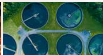
WATER & WASTE WATER MANAGEMENT